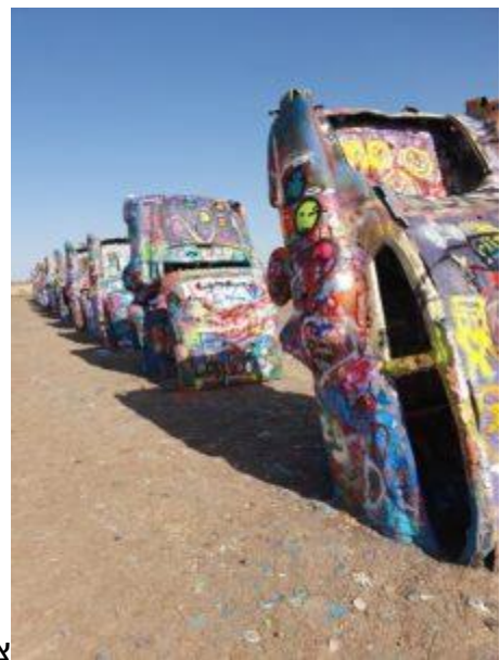
צילום מתוך המסלול – צילום אביחי שמידט

"היה לה טעם של כביש 66, של מסע שיש בו גילויים מרתקים. מדובר על כביש באורך ארבעת אלפים קילומטר ואם ניקח בחשבון את הגיחות מהמסלול הראשי לעוד כמה מוקדי משיכה הכרחיים לביקור שנמצאים 'על הדרך', הייתי אומר שהמסלול כולו משתרע לאורך ששת אלפים קילומטר."