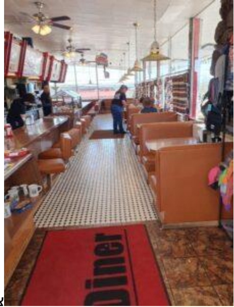
צילום מתוך המסלול