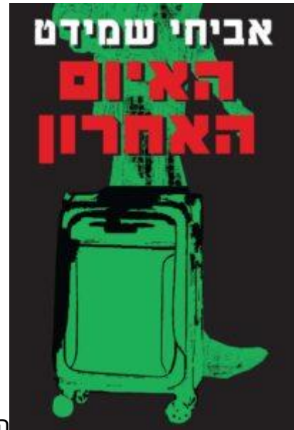
האיום האחרון מאת אביחי שמידט

פצצה גרעינית ניידת במזוודה מתגלה בחדר בבית מלון בתל אביב. הפעם הפצצה עקרה. בפעם הבאה היא כבר לא תהיה, אלא אם כן תמלא מדינת ישראל את רשימת הדרישות המצורפת. לישראל אין כוונה להיענות לדרישות וההנהגה הישראלית מתכנסת במהירות כדי להחליט איך לפעול. הרעיון שהיא מאמצת בזמן הקצר שעומד לרשותה עלול להיות הרה אסון. העלילה המרתקת והלא שגרתית מתפתחת במוקדים רבים ומשולבים בה טיפוסים יוצאי דופן – צלם עיתונות צרפתי שאפתן, מבריחת סחורות מנאפולי, מלחין רוסי נודע, פצחן מחשבים ישראלי, מחסלים בשירות המוסד, מומחי חבלה, דיפלומטים איטלקים וגם מחבר ספרי מתח שהוגה רעיון כל כך יוצא דופן וכל כך מטריד וקיצוני – יש אומרים שטני, שעלול להשפיע על גורל האנושות כולה. אילן רותם, סופר המתח, יחד עם אלינור מורה – סוכנת המוסד ואחרים, פועלים בעולם כולו לפי תוכנית משולבת ומתואמת היטב כדי למגר אחת ולתמיד את הטרור הבינלאומי.